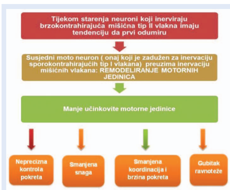
Slika 2. Remodeliranje motornih jedinica

Posljedica navedenog smanjenja mišićne mase je da mišići starijih osoba pokazuju smanjenje funkcionalnih sposobnosti kao što su snaga ili izdržljivost 15,34 . Postoje i dokazi da mišići ruku i nogu nisu ravnomjerno zahvaćeni. Gubitak mišićne snage u nogama je oko 40 % u odnosu na 30 % gubitka snage u mišićima ruku između 30. i 80. godine života 35 .