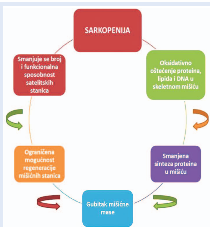
Slika 3. Sarkopenija je jedan od glavnih uzroka slabosti kod starije populacije