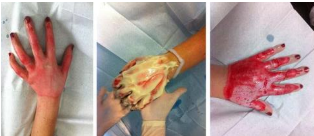
Slika 6. Opekline lijeve ruke. Korišten enzimski debridman. (18)

mjesto u području zbrinjavanja opekline, zahtijevaju posebnu pažnju i liječenje. Ruke su zahvaćene u 30-60% svih pacijenata s opeklinama. Zbog anatomije šake (važne i delikatne strukture nagomilane u malom ograničenom prostoru bez subdermalnog mekog tkiva), kirurški debridman opečenog tkiva tehnički je težak i može uzrokovati značajne komplikacije. (23) Objavljena su istraživanja enzimskog debridmana s obećavajućim rezultatima. Primjena je moguća izvan operacijske sale sve dok je osigurana analgezija tijekom ovog inače bolnog postupka debridmana. Ovaj postupak u opeklinama ruku ima koristi budući da su ti pacijenti pokazali ranije vrijeme do zarastanja rana i bolje dugoročne rezultate (slika 6). (18)