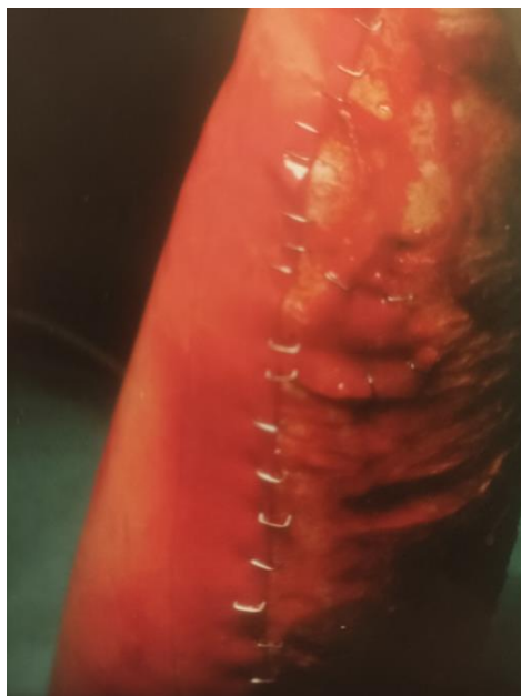
Slika 8. Integra (4)

migraciju fibrobasta, endotelnih stanica i limfocita. Dermalna strana se postavlja na opeklinu ranu dolje, a vanjski sloj predstavlja mehaničku barijeru. Nakon 3 do 4 tjedna stvara se neodermis i onda se skida sintetski sloj, a rana se prekriva tankim slobodnim kožnim transplantatom. Davajuća regija brzo zarasta i ne ostavlja ožiljke. Kod primjene integre funkcionalnost zglobova je izvrsna, niža je učestalost infekcije, a posljedično tome kraća hospitalizacija. Brza regeneracija kože i fiziološko zatvaranje rane su također prednosti integre. Nedostaci su visoka cijena i dodatne kirurške intervencije nakon 3- 4 tjedna. (4) U nerazvijenim zemljama koje imaju najveću učestalost opeklina zbog visoke cijene je često nedostupna. (18)