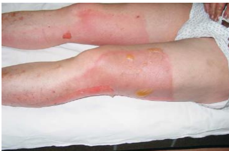
Slika 2. II A stupanj opekline (8)

Površinske dermalne opekline IIA°. Karakterizira ih oštećenje epidermisa u cijelosti i papilarnog dermisa. Koža je neravnomjerno žarko crvena, vlažna i bolna s mnogobrojnim mjehurićima koji su puni tekućine plazminog eksudata bogatog proteinima. Opekline mogu bit bolne, a na pritisak anemiziraju što je znak da kapilarna mreža nije oštećena. Radi perifernog oštećenja živčanog tkiva, značajna je osjetljivost na palpaciju. Edem je često prisutan zbog destrukcije vaskularne mreže. Opekline zarastaju spontano unutar 3 tjedna i bez rezidualnih ožiljaka, ali javljaju se promjene u pigmentaciji kože koje s vremenom nestaju (slika 2).