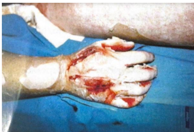
Slika 11. Dorzalna eskarotomija (4)

ekstremitet poslije navednog zahvata. Područja gdje se napravila eskarotomije kasnije se pokrivaju kožnim transplantatima, a kozmetički učinci nisu najbolji. Prsti zarastaju fiziološki uz blaga ograničenja funkcionalnosti. Obično u opeklinama šake je zahvaćen dorzum, a kako bi se spriječio razvoj kontraktura, stavlja se posebna udlaga u karakterističan položaj. Na palmarnoj strani stoji udlaga, a šaka je u umjerenom fleksiji s abduciranim palcem. Ponekad kod dubokih i opsežnih opeklina ruku koriste se i Kirschnerove žice. Tim žicama se MCP zglob fiksira u fleksiji, a IP zglob u ekstenziji. Alenteza se izvadi kroz dva do tri tjedna, odnosno nakon što se završilo pokrivanje opeklina. (4)