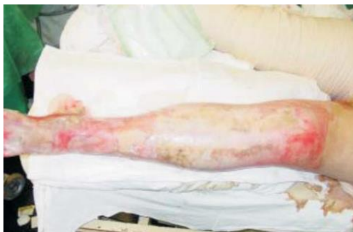
Slika 3. II B stupanj opekline (8)

obično javljaju nekoliko sati nakon ozljede, ali u rijetkim slučajevima. Zahvaćena površina je pretežito suha i manje bolna jer su oštećeni nervni završetci. Koža se može obnoviti od epitelnih stanica folikula dlaka i kanala žlijezda znojnica. Proces cijeljenja je dulji od 3 tjedna, a često ostaju promjene u pigmentaciji kože i hipertrofični ožiljci. Preporuča se rana ekscizija nekrotičnog sloja i transplantacija kože za optimalan estetski rezultat (slika 3). (2,4,8,15)