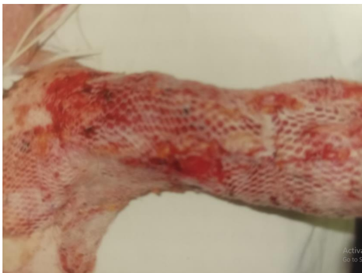
Slika 7. Mrežasti kožni transplantat (4)

manje je zapravo pokrivena opeklinška rana i tijekom sporog procesa epitelizacije dolazi do veće mogućnosti stvaranja hipertrofičnih ožiljaka, a također su lošiji kozmetički i funkcionalni rezultati (4,18)