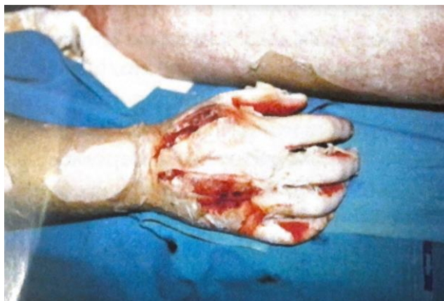
Slika 11. Dorzalna eskarotomija (4)

ekstremitet poslije navednog zahvata. Područja gdje se napravila eskarotomije kasnije se pokrivaju kožnim transplantatima, a kozmetički učinci nisu najbolji. Prsti zarastaju fiziološki uz blaga ograničenja funkcionalnosti. Obično u opeklinama šake je zahvaćen dorzum, a kako bi se spriječio razvoj kontraktura, stavlja se posebna udlaga u karakterističan položaj. Na palmarnoj strani stoji udlaga, a šaka je u umjerenom fleksiji s abduciranim palcem. Ponekad kod dubokih i opsežnih opeklina ruku koriste se i Kirschnerove žice. Tim žicama se MCP zglob fiksira u fleksiji, a IP zglob u ekstenziji. Alenteza se izvadi kroz dva do tri tjedna, odnosno nakon što se završilo pokrivanje opeklina. (4)