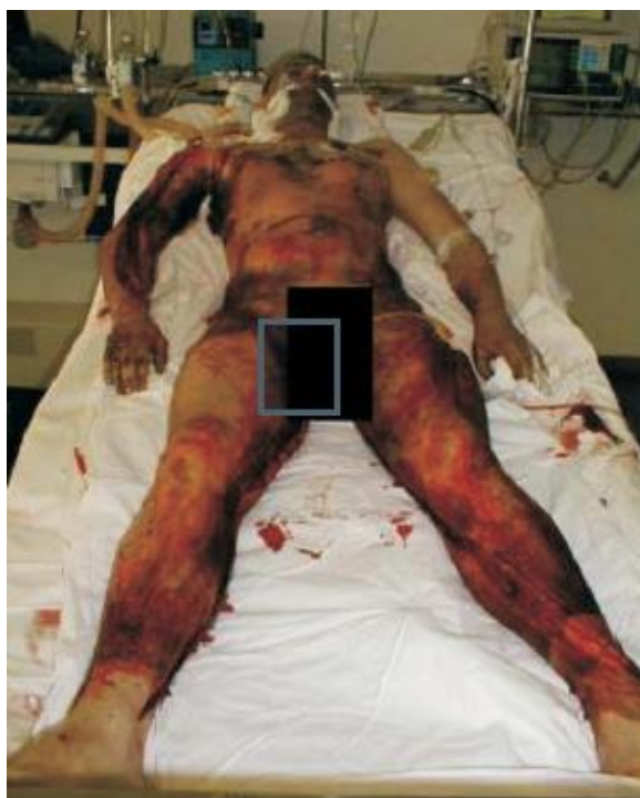
Slika 4. III stupanj opeklina izazvan plamenom (8)

Budući da je kožna barijera oštećena, nekrotično tkivo je odlična podloga za razvoj infekcije i sepse u opeklinama ovog stupnja. Ovako stanje uzrokuje pojačane metaboličke potrebe zbog toga u liječenju ovih opeklina iznimno je važna agresivna i rana nadoknada tekućine te pojačana enteralna ili parenteralna prehrana. Rane cijele samo po rubovima stoga rana kirurška ekscizija i presađivanje kože je neminovno. Opekline koje zahvaćaju preko 40 % TBSA kirurško liječenje treba planirati u više navrata (slika 4). (2,4,8,15)