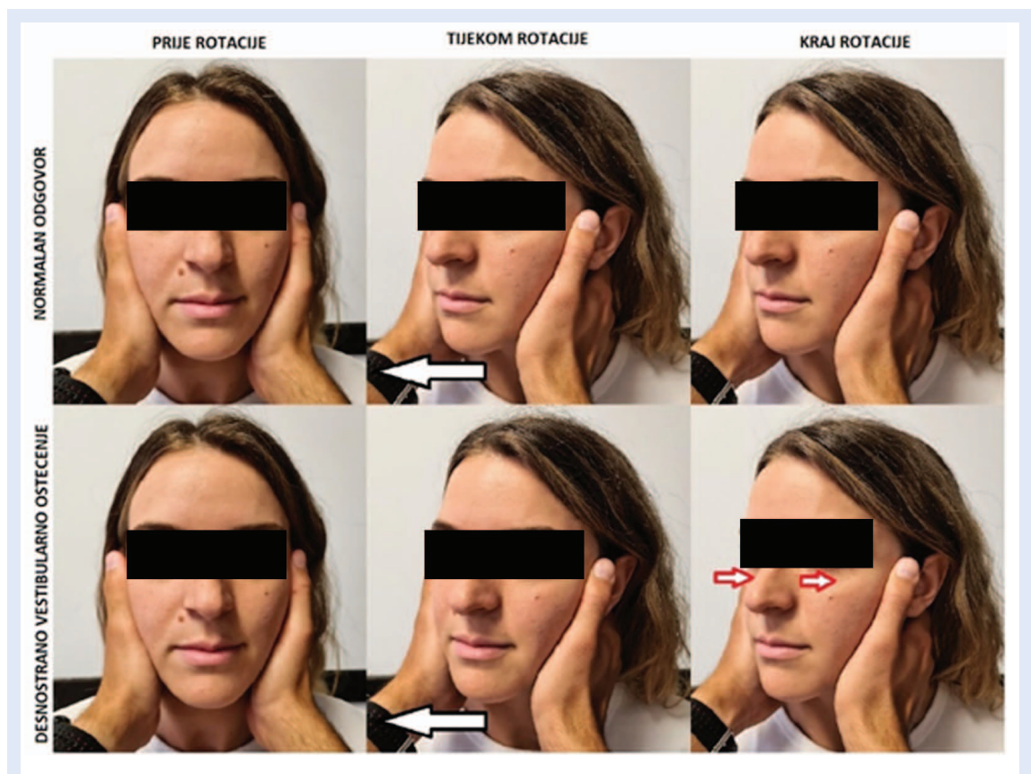
Slika 2. Desnostrani klinički Head Impulse Test (cHIT)

Na slikama je prikazan desnostrani Head Impulse Test. U gornjem je redu prikaz urednog odgovora, a u donjem prikaz odgovora kod desnostranog vestibularnog oštećenja.