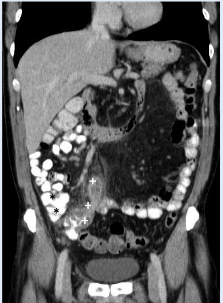
Slika 4. CT rekonstrukcija u koronalnoj ravnini pokazuje upalno zadebljan i kranijalno usmjereni crvuljak sa zamućenjem okolnog masnog tkiva (* cekum, + crvuljak)

Prvi znanstveni rezultati o primjeni pretrage CT-om kod suspektnog akutnog apendicitisa pojavili su se početkom 1990-ih. Svrha ovih istraživanja je bila ispitati dijagnostičku točnost CT-a u postavljanju dijagnoze akutnog apendicitisa u cilju smanjenja stope negativnih apendektomija, što bi u konačnici dovelo do smanjenja mortaliteta, operativnog rizika i bolničkih troškova. Do početka istraživanja uloge CT-a stopa negativne apendektomije varirala je između 15 i 25 %, dok najnovija istraživanja objavljuju stopu od 4,3 % 14-16 . CT pretraga pouzdano detektira patologiju akutnog apendicitisa, osobito u slučajevima kada je klinička slika nespecifična, a ultrazvukom se ne mogu dobiti dodatne dijagnostičke informacije. Osjetljivost CT pregleda u dijagnozi akutnog apendicitisa kreće se u rasponu od 90 do 98 %, dok je specifičnost od 91 do 98 % 17,18 . Najvažniji CT znakovi akutnog apendicitisa obuhvaćaju zadebljanje crvuljka s promjerom većim od 6 mm, proširenje lumena, upalne promjene okolnog masnog tkiva i ekstraluminalnu tekućinu 19 . U našoj ustanovi ultrazvučni pregled u tih pacijenata daje zadovoljavajuće rezultate i predstavlja prvu dijagnostičku metodu, osim kod atipične lokalizacije crvuljka (slika 4). U jednog pacijenta s retrocekalnim apendicitisom CT je pogrešno ukazao na realni infarkt.