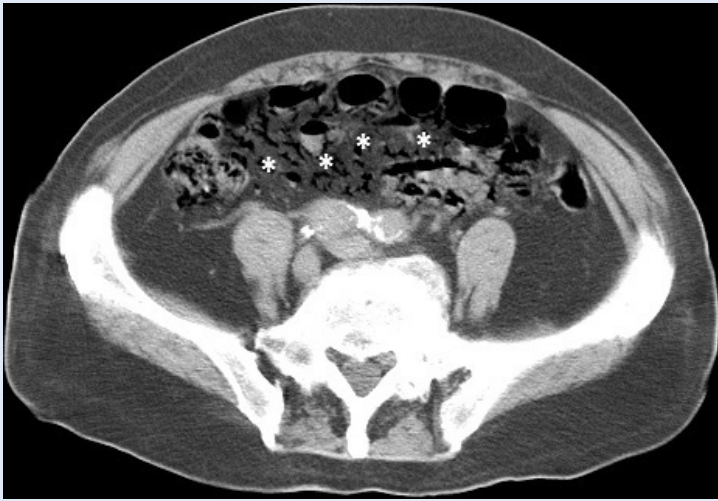
Slika 6. Aksijalni CT presjek kroz donji abdomen pokazuje crijevnu gangrenu s nakupljanjem plina u mezenterijalnim venama (* zrak u mezenterijalnim venama)