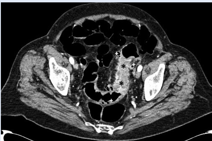
Slika 3. Aksijalni CT presjek kroz zdjelicu pokazuje zadebljanje stijenke sigmoidnog kolona s intenzivnom postkontrastnom opacifikacijom (* zadebljanje stijenke, + divertikli)

umoperitoneum naziva nekirurški ili spontani i može se javiti u značajnog broja pacijenata, prema nekim autorima do 10 % 5-7 . Budući da je nekirurški pneumoperitoneum relativno rijedak nalaz, trenutno znanje o navedenoj patologiji ograničeno na nekoliko prikaza slučaja i preglednih članaka. Do danas niti jedno istraživanje nije sustavno obradilo problematiku razlikovanja kirurškog od nekirurškog pneumoperitoneuma, stoga u navedenoj problematici postoji prostor za provođenje daljnjeg istraživanja koje bi moglo pomoći u smanjenju nepotrebnih kirurških zahvata uz smanjenje mortaliteta i uštedu bolničkih financijskih sredstva. S druge strane, kod prevelike količine slobodnog plina u peritonealnoj šupljini izostaje specifično nakupljanje uz određeni organ te se, stoga, ne može odrediti točno mjesto perforacije. Poseban oprez je potreban u pacijenata s nedavno učinjenom laparotomijom ili laparoskopijom kod kojih slobodni plin u peritonealnim recessusima ne predstavlja patološki nalaz.