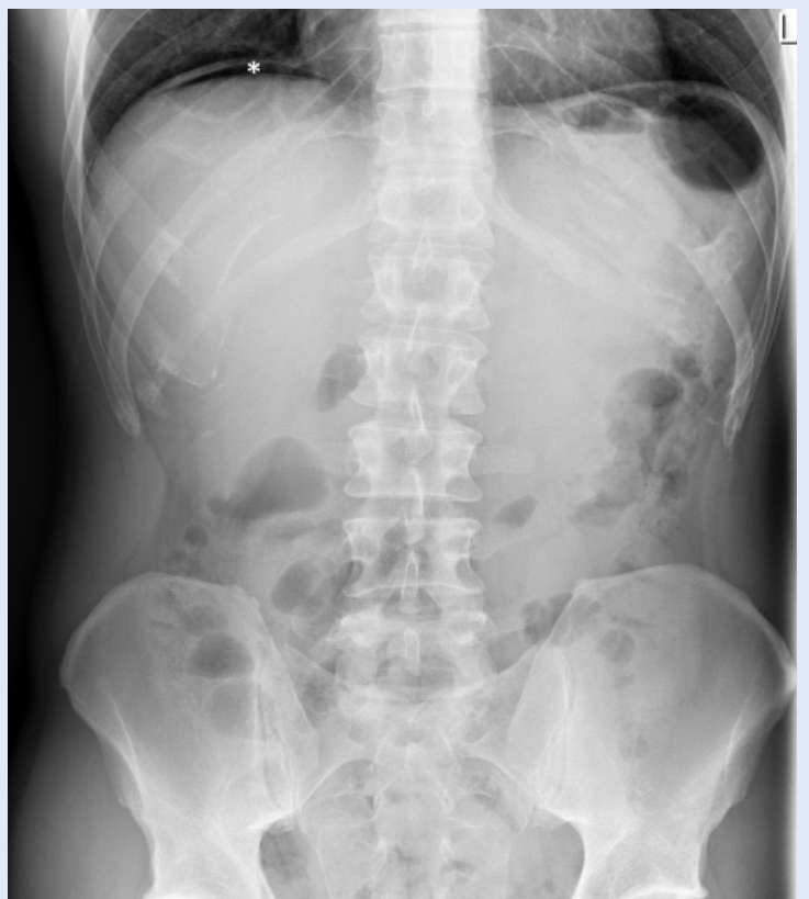
Slika 1. Nativni radiogram abdomena u stojećem stavu pokazuje slobodni plin između desne hemidijafragme i jetre (* srp slobodnog zraka ispod desne hemidijafragme)

Diferencijalna dijagnoza akutnog abdomena široka je i uključuje spektar uzroka od benignih, kod kojih operativni zahvat nije indiciran, do životno ugrožavajućih s visokom stopom mortaliteta. Mnogi uzroci akutnog abdomena imaju slične kliničke karakteristike te je radiološka dijagnostika neophodna u otkrivanju uzroka i ranijoj detekciji onih koji zahtijevaju hitno kirurško liječenje.