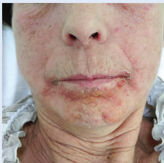
Slika 2. Edem kapaka i obraza uz perioralne vezikule i ljuštenje u ranoj fazi bolesti

kovanih DRESS/DIHS-om. Također se mogu pojaviti miokarditis, perikarditis, intersticijski pneumonitis, tireoiditis, cerebralni vaskulitis i encefalitis 2,4 . Moguća je i pojava artralgija i artritisa, a u slučaju DRESS/DIHS-a uzrokovanog alopurinolom opisano je i gastrointestinalno krvarenje. Ono što ovaj sindrom čini još složenijim i stoga