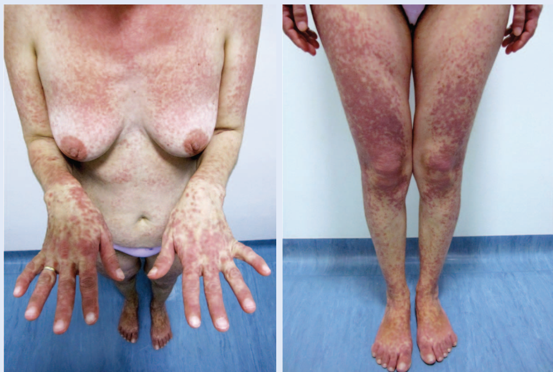
Slika 1. Generalizirani makulopapulozni osip uz naglašeniju folikularnu distribuciju