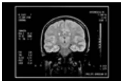
Slika 1. Sitna oštećenja u bijeloj supstanci lijeve moždane polutke, kompatibilne s demijelinizacijom. Jedna se nalazi u prednjem čeonom području, bočno od čeonog roga, a druga je u precentralnom području subkortikalno.