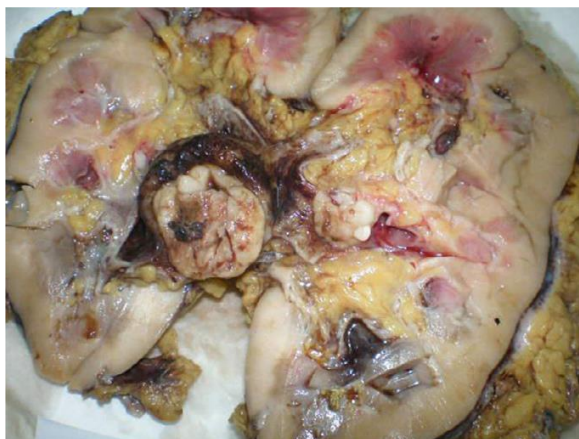
Slika 7. Prikaz presjeka oštećenog bubrega.