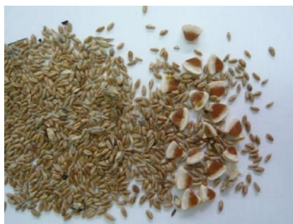
Slika 4. Sjemenke vučje stope

Tek je 2013. godine predložen drugačiji put unosa aristolohične kiseline u ljudski organizam jer je ustanovljeno da neki pšenični usjevi, u kojima vučja stopa raste, stari i razgrađuje se, tijekom godina akumuliraju određenu količinu same kiseline korijenjem iz tla te je tako prenose na druge poljoprivredne vrste. Posljedično, dokazalo se da korijenje kukuruza i krastavaca može apsorbirati aristolohičnu kiselinu što je dovelo do prirodnog unosa kontaminanta u lanac ishrane i jačanje mogućnosti intoksikacije na endemskim područjima (72). Naknadno je proveden eksperiment uzgoja salate, rajčice i mladog luka na onečišćenom tlu te je istraživanje pokazalo da je aristolohična kiselina doista translocirana i bioakumulirana u drugim biljnim strukturama (korijenju, listovima te plodovima), ali i da je otporna na djelovanje mikroorganizama iz tla. Štoviše, ne samo da je kiselina ostala vrlo postojana u metabolizmu biljnih stanica, nego je i dulje vrijeme bila prisutna u prehrambenim proizvodima uzgojenih kultura. Slijedom navedenog, duži period konzumiranja hrane pripremljene od ovakvih usjeva također može rezultirati endemskom nefropatijom (73).