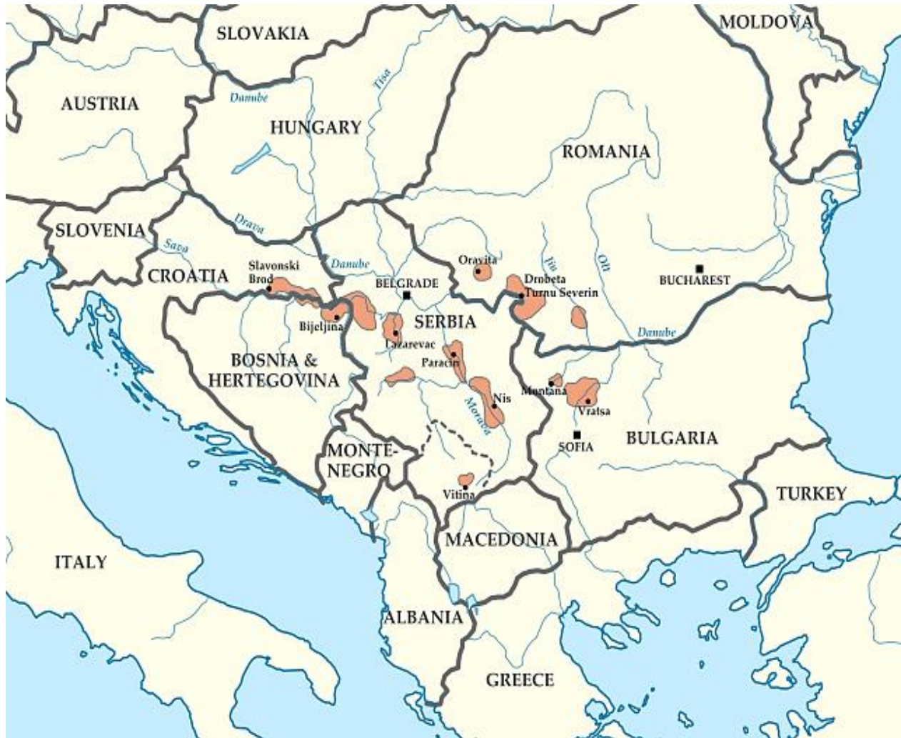
Slika 1. Distribucija endemskih žarišta balkanske endemske nefropatije.