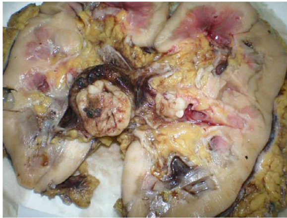
Slika 7. Prikaz presjeka oštećenog bubrega.