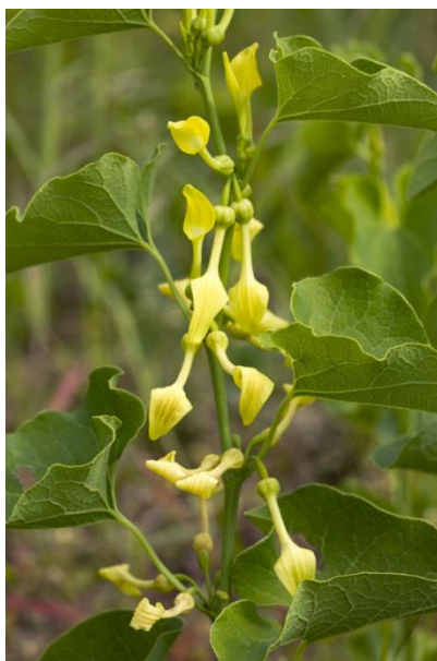
Slika 3. Žuta vučja stopa (lat. Aristolochia clematitis L.)

Vučja stopa (žuta vučja stopa, vučja jabučica, divlji jabučnjak, lat. Aristolochia clematitis L.) je višegodišnja zeljasta parazitska biljka koja pripada porodici vučjih stopa (lat. Aristolochiaceae ). Ima uspravnu stabljiku žutozelene boje, velike srcolike listove, svijetložute cvjetove koji u donjem dijelu poprimaju oblik jabučice (slika 3) te zelene plodove u obliku čahura u kojima se nalaze sitne i trokutaste smeđe sjemenke (slika 4), a naraste do visine jednog metra. Neugodnog je mirisa, a iz cvjetova se širi miris trulog mesa privlačeći tako male insekte koji ih oprašuju (70). Svi dijelovi biljke, a osobito sjemenke, sadrže otrovne alkaloidne od kojih je najznačajnija upravo aristolohična kiselina. Raste uglavnom uz ceste, u šikarama, vinogradima te drugim poljoprivrednim područjima, a u toplim i vlažnim krajevima dunavske doline najčešće uz pšenicu (63). Latinski naziv Aristolochia potječe od grčkih riječi – „ áristos “ što znači „lijep“ i „ lochia “ što znači „porodilja“, odnosno „mjesečnica“ jer su je stari Grci i Egipćani koristili kao ljekovitu biljku za poticanje poroda i olakšavanje ponovnog dobivanja mjesečnice. Clematitis dolazi od grčke riječi „ klema “ što znači „vitica“ označavajući princip rasta same biljke. Oblik cvijeta podsjeća na položaj fetusa pa se smatralo da biljka pospješuje porođaj po čemu je i dobila ime, no veće količine služile su za namjerno izazivanje pobačaja (70,71).