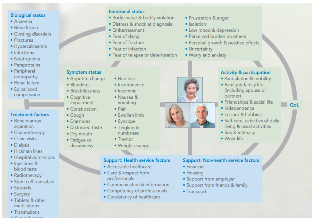
Slika 1. Čimbenici koji utječu na kvalitetu života bolesnika. Preuzeto iz: Osbourne TR, et al. Understanding what matters most to people with multiple myeloma: a qualitative study of views on quality of life. BMC Cancer. 2014; 14: 496. (27)

bolešću (prikazani na Slici 1.). Simptomatologija bolesti ima neizravan učinak na kvalitetu života, budući da utječe na ukupnu kvalitetu života samo ako djeluje na čimbenike kao što su aktivnost pacijenta, emocionalni status te faktori podrške koji imaju izravni učinak. Ovaj neizravni odnos ima implikacije na dizajn HRQoL upitnika, koji se često pogrešno temelje samo na simptomatologiji bolesti. Čimbenici liječenja pokazali su se važnima, iako ih često nema u upitnicima za procjenu HRQoL. (27)