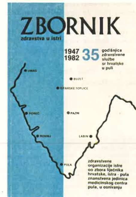
Slika 7. Naslovna strana četvrtog »Zbornika zdravstva u Istri« izdanog u povodu 35. obljetnice djelovanja zdravstvene službe SR Hrvatske u Puli

I Opća bolnica, i kasnije Medicinski centar prelazili su razne etape svog razvoja, bilježili su i uspone, ali ponekad i teške trenutke, no, razvojna se crta uvijek kretala prema gore (slika 6).