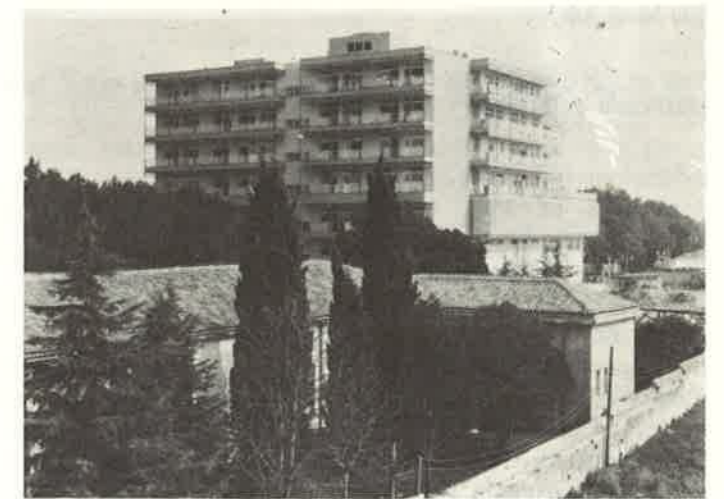
Slika 6. Nova zgrada Rodilišta i ginekologije Medicinskog centra u Puli otvorena 1979. godine. Na petom je katu smješten Dječji odjel

Pula ima i karakteristike kongresnog grada. Od 1960. godine održava se svake godine Neuropsihijatrijski simpozij koji je osnovao prof. dr Hans Bertha, a koji se od Jugoslavensko-austrijskog simpozija postupno razvio u ugledni međunarodni skup s brojnim sudionicima iz evropskih, pa i izvanevropskih zemalja.