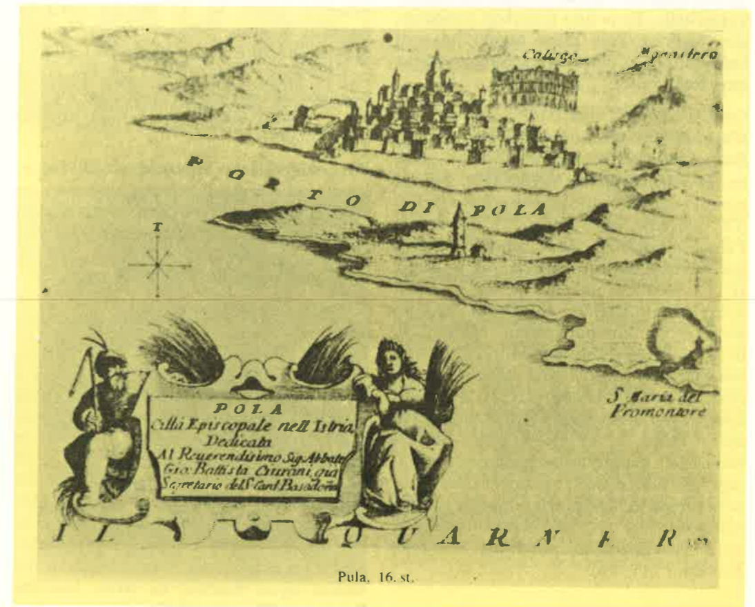
Slika 1. Pula u XVI. stoljeću. U desnom gornjem kutu vidi se samostan i opatija Sv. Mihovil nad Pulom

druga jednobrodna koja je služila kao mauzolej istarskim kneževima i njihovim porodicama. Samostan je bio izgrađen s lodama, parkom i vrtom za boravak i manualni rad redovnika (labor manuum), pa i za rekreaciju njihovu i njihovih gostiju. Temelje tih crkava mogao je promatrati, iako u ruševnom stanju, još Kandler u prošlom stoljeću. Međutim, i Locatelli je opisao 1590. godine raskoš ovih građevina na Mihovilovom brdu (11, 13) (slika 1). Potkraj šesnaestog stoljeća na tom su se mjestu mogla vidjeti uredna dvorišta, lođe i apartmani i mramorna cisterna. U sljedećem se stoljeću stanje u ovoj benedik- tinskoj opatiji sve više pogoršava. To je vrijeme kad su Istrom harale epidemije kuge i malarije, koje su inače imale značajan utjecaj na depopulaciju istarskog poluotoka. Vjerojatno je da je bogatstvo i