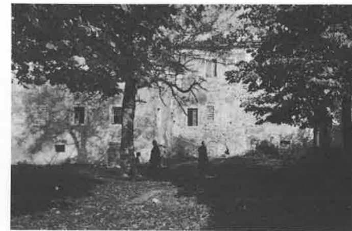
Slika 2. Današnji izgled kapucinskog samostana u Vodnjanu koji je u napoleonovo vrijeme bio pretvoren u francusku vojnu bolnicu

prvu općinsku bolnicu u Puli s 84 kreveta. U početku je upravljanje ove bolnice bilo povjereno organizaciji »Bratstvo sv. Tome«. No, i ovu zdravstvenu ustanovu trebali bismo gledati još uvijek više kao dom za smještaj starih i nezbrinutih, a možda manje kao bolnicu u pravom smislu riječi. Upravo ovo jedinstvo bolnice i ubožnice podržavat će koncepciju da se i ubuduće grade bolnice uz koje će se locirati i dom staraca (Casa Pia di Ricovero) (1).