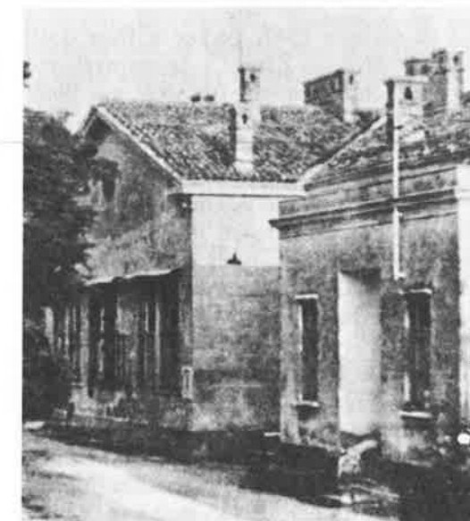
Slika 5. Stara zgrada Odjela za zarazne bolesti u Puli 1947. godine

Trebalo je početi živjeti i raditi u opustjelom gradu, u opustošenoj bolnici, zadobiti povjerenje ljudi i pokazati im vrijednost i vitalnost naše zdravstvene službe. Nije to bilo lako. Nekoliko malodušnijih ubrzo je zbog raznoraznih okolnosti napustilo Pulu, ali mi ostali smo se latili tog teškog posla. Radi ilustracije navodimo kako npr. nismo imali pedijatra, a kad je nakon nekoliko mjeseci došla dr Vanda Hahamović, bila je prisiljena da vodi ambulantu za djecu onako usput – u prijemnoj ambulanti. Pedijatrijske bolesnike smještavala je u prvo vrijeme na zarazni odjel (slika 5). Nismo imali ni internista. Jedan od nas (Z. M.), onda stažist, dobio je dužnost da se