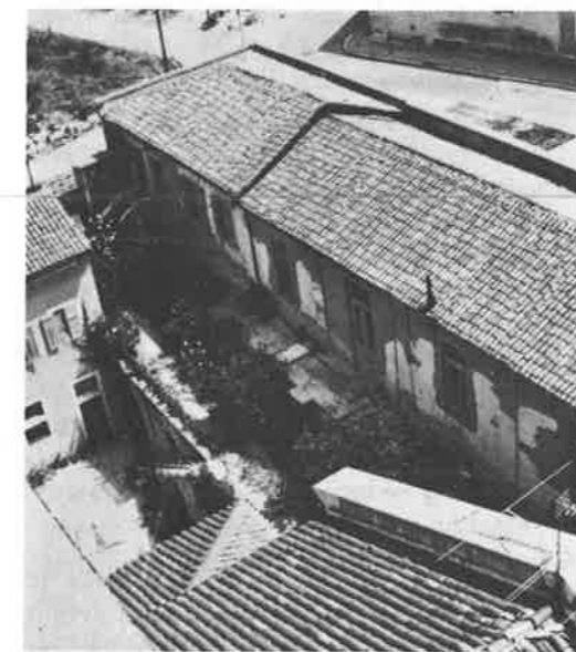
Slika 3. Zgrada stare općinske bolnice nad Arenom iz sedamdesetih godina prošlog stoljeća

prvu općinsku bolnicu u Puli s 84 kreveta. U početku je upravljanje ove bolnice bilo povjereno organizaciji »Bratstvo sv. Tome«. No, i ovu zdravstvenu ustanovu trebali bismo gledati još uvijek više kao dom za smještaj starih i nezbrinutih, a možda manje kao bolnicu u pravom smislu riječi. Upravo ovo jedinstvo bolnice i ubožnice podržavat će koncepciju da se i ubuduće grade bolnice uz koje će se locirati i dom staraca (Casa Pia di Ricovero) (1).