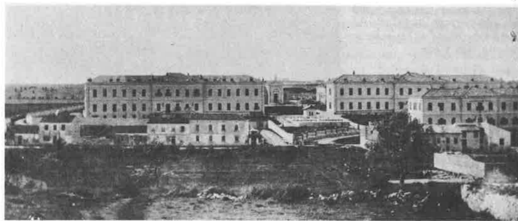
Slika 4. Nova je bolnica u Puli izgrađena na Mihovilovu brdu 1896. godine

ništva, uvidjelo se da ova bolnica, koja je bila sagrađena pokraj amfiteatra Arene, ne odgovara više smještaju bolesnika ni medicinskom radu, a k tome nije se imala kamo širiti zbog novih kuća, koje su u međuvremenu bile izgrađene u njezinoj neposrednoj blizini. To je bio razlog da se predstavnici grada odluče za izgradnju veće nove bolnice.