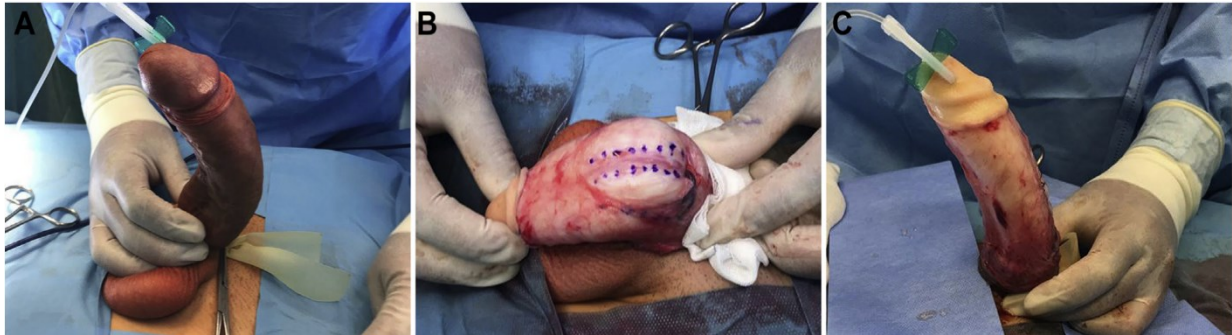
Slika 4: plikacija penisa (preuzeto iz Almeida J. L., Felício J., Martins F.E. Surgical Planning and Strategies for Peyronie's Disease. Sexual Medicine Reviews, 2021.)