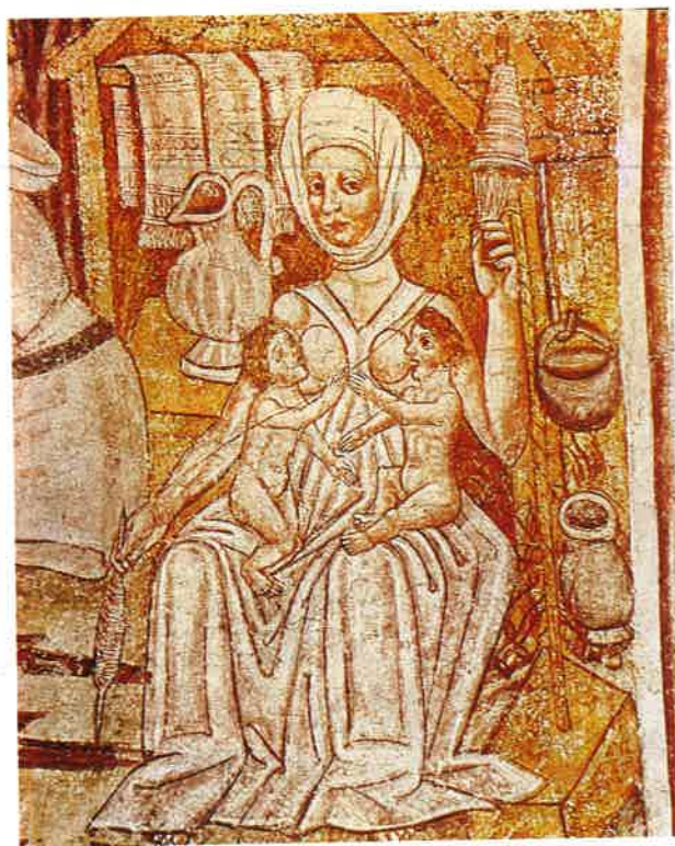
Slika 5 Ivan iz Kastva i suradnici, približno 1490. Eva, detalj.