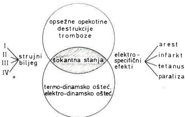
Pregledni prikaz oštećenja uslijed djelovanja električne struje.