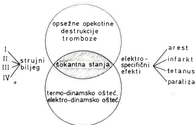
Pregledni prikaz oštećenja uslijed djelovanja električne struje.