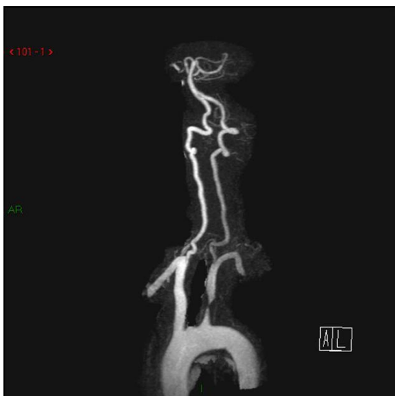
Slika 4. MRA prikaz stenozne lijeve potključne arterije