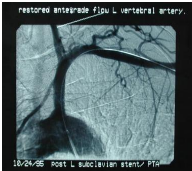
Slika 6. Uspješno postavljen stent subklavijalne stenozе sa vraćenim. Anterogradnim tokom vertebralne arterije