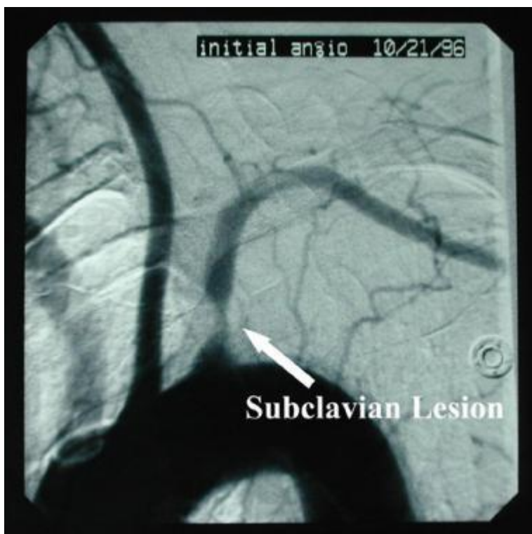
Slika 1. Angiografija-prikaz stenozе lijeve arterije subklavije

izmjenjive: pušenje, hiperkolesterolemija, diabetes melitus, hipertenzija i hiperhomocisteinemija. Drugi ali rijetki uzroci okluzije potključne arterije uključuju arteropatije kao što su: Takayasu arteritis ili arteritis divovskih stanica. Kongenitalne anomalije kao što je desni aortalni luk sa izolacijom a.subklavije ili anomalije ogranaka truncusa brachiocephalicusa također su jedan od rijedih uzroka stenozе potključne arterije. Kirurški zahvati pri koarktaciji aorte ili Blalock-Taussig metoda za Fallot tetralogiju mogu dovesti do stenozе a.subklavije. Sindrom kompresije toraksa (poremećaj koji nastaje kada su krvne žile i živci u području između klavikule i 1. rebra komprimirane) isto dovodi do okluzivne bolesti a.subklavije ali u vrlo rijetkim slučajevima jer sindrom pretežito obuhvaća potključnu arteriju iza ogranaka a.vertebralis.(2)