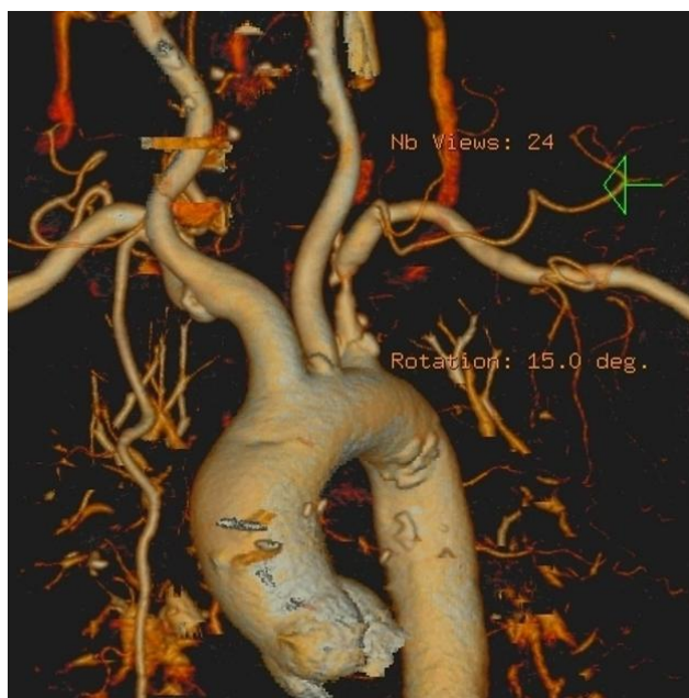
Slika 5. 3D CT angiografija prikaz luka aorte i njegovih ogranaka sa stenozom lijeve a.subklavie

CT angiografija - Kad ultrazvučne tehnike nisu uvjerljive i kontrastna MRA kontraindicirana, CT angiografija može se koristiti za isključivanje ili kvantifikaciju stenozne potključnih arterija. Smjer toka u vertebralnim arterijama se nemože odrediti ali se sve ekstrakranijalne i intrakranijalne vaskularne lezije mogu identificirati.(5)