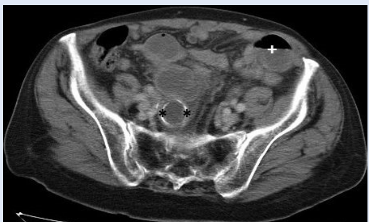
Slika 9. Aksijalni CT presjek kroz zdjelicu pokazuje rubno kalcificirani kongrement žučnog mjehura u lumenu tankog crijeva uz aerolikvidni nivo koji ukazuje na razvoj ileusa (* žučni kamenac, + aerolikvidni nivo)