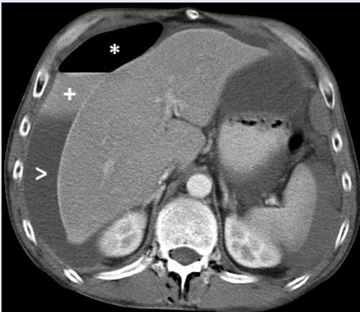
Slika 2. Aksijalni CT presjek pokazuje u desnom subfreniju uslojavanje sadržaja zbog perforacije duodenalnog ulkusa (* slobodni zrak, + ekstrasvazat kontrasta, > ascites)

Pacijent s kliničkom slikom akutnog abdomena i alteriranim laboratorijskim nalazima često pobuđuje sumnju na perforaciju šupljeg organa, koja u većini slučajeva bude potvrđena nalazom CT-a (slika 2). No dokaz pneumoperitoneuma na CT-u abdomena ne mora nužno značiti da je potreban kirurški zahvat. U literaturi se takav pne-