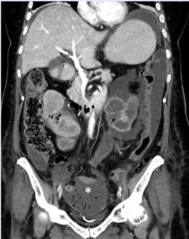
Slika 7. CT rekonstrukcija u koronalnoj ravnini pokazuje nakupljanje tekućeg sadržaja s mjehurićima plina u zdjeličnim reesusima i u oba parakolična žlijeba – sterokalni peritonitis (* mjehurići plina u zdjeličnoj kolekciji)

CT je pouzdana metoda dijagnostike abdominalnih hernija, no u našoj seriji to je bila relativno rijetka uputna dijagnoza 20,21 . Kirurzi su se najčešće oslonili na klinički nalaz kada su u pitanju vanjske hernije. Kod unutarnjih hernija CT dijagnostika također je zahtjevna. U našeg pacijenta bila je prisutna unutarnja hernija koju smo procijenili kao gangrenu tankog crijeva, no operacijski nalaz ukazivao je na vijabilnu vijugu koja nije resecirana nego samo dezvaginirana. Invaginacija je najčešće ileocekalna, a CT jasno prikazuje teleskopsko uvlačenje crijeva (slika 5).