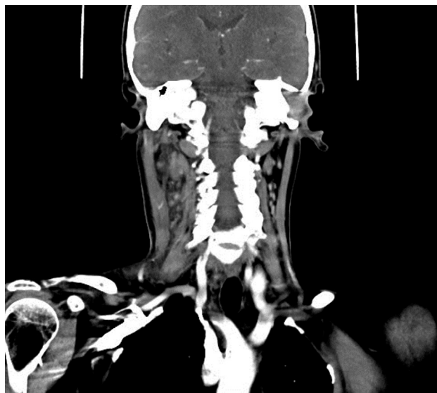
Figure 2: MSCT of the neck shows a conglomerate of necrotic and enlarged submandibular lymph nodes and lymph nodes, along the jugular chain on the right as well as infiltrations caused by inflammation on the surrounding fatty tissue and the fatty tissue of the carotid region. The right parotid gland is enlarged without abscess presence.

Tablica 2: Dijagnostika moguće etiologije limfadenitisa kod pacijentice