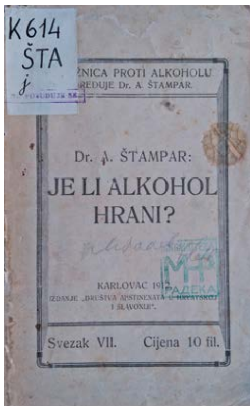
Slika 2. Knjižica proti alkoholu ; Dr. A. Štampar: Je li alkohol hrani?, Karlovac, 1912.