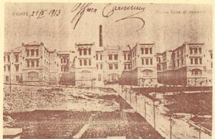
Sklop ubožnice »Braća Branchetta«, godine 1913.

U ubožnici trebaju biti četiri odjela za 70 muškaraca, 70 žena, 30 dječaka i 30 djevojčica. U okviru Doma treba postojati kapela, prostorije za administraciju, bolesničke sobe i stan ravnatelja. Od prispjelih 9 projekata prvu nagradu dobio je projekt »Aria e luce« (Zrak i svjetlost) čiji je autor talentirani riječki arhitekt Carlo Pergoli.