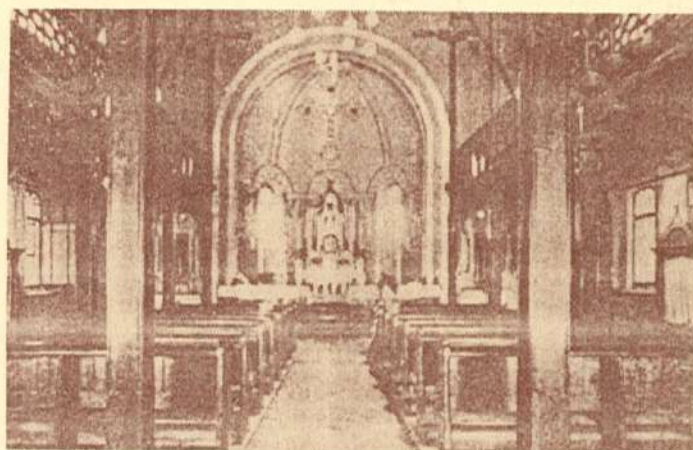
»Unutrašnjost kućne kapele«

projektirao funkcionalno, bez velikog dekora. Četiri vertikalno isturena dijela zgrade naglašavaju dispoziciju unutrašnjosti koju je Pergoli izvanredno riješio odvojivši muški od ženskog odjela koji su vezani jedino zajedničkim atrijem i kapelom.