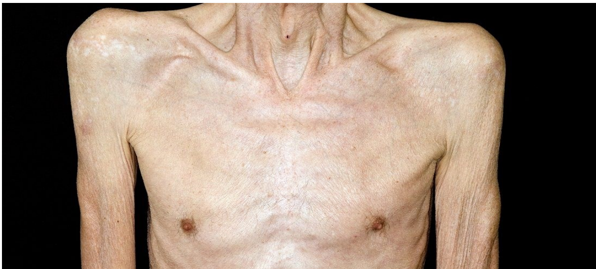
Slika 2. Bolesnik s kaheksijom

U kaheksiji je gubitak mišićne mase primaran problem koji se ne može adekvatno popraviti nutritivnom potporom. S vremenom ovo stanje dovodi do raznih funkcionalnih oštećenja pa je u onkoloških pacijenata cilj izbjeći ili odgoditi nastup kaheksije. U terapiji se koriste eikozapentaenska kiselina (EPA- engl. eicosapentaenoic acid ), meggestrol-acetat, a nerijetko i glukokortikoidi. (1)