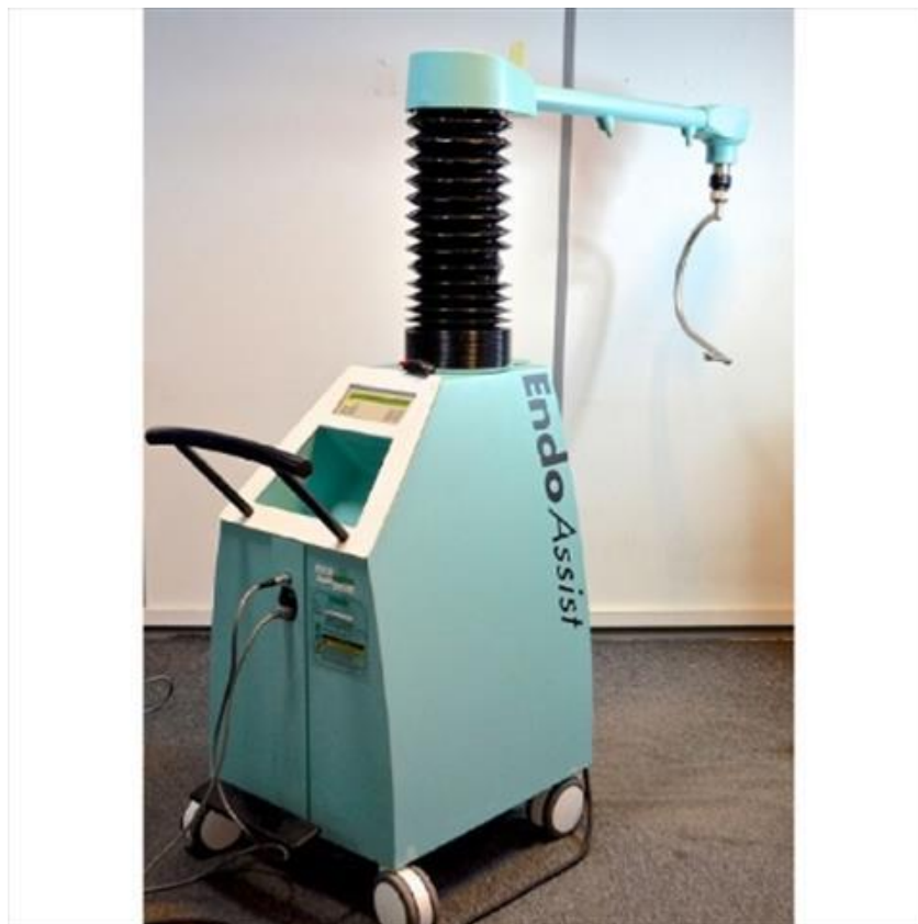
Slika 5. Endoassist robotski sustav

Sustav je razvijen u Armstrong Healthcare centru u High Wycombe, UK, također u 1990-im godinama.(slika 5.) Jako je sličan AESOP sustavu, a funkcija mu je da drži i pozicionira endoskop. Endoassist se kontrolira džojstikom ili senzorom koji se nosi na glavi. Uređaj sa trakom za glavu šalje infracrvene signale koji omogućuju Endoassist-u da prati kretanje glave kirurga. Kada kirurg pritisne nožnu papučicu, robot pomiče kameru u smjeru u kojem kirurg gleda na monitoru. Znatno je jeftiniji od AESOP sustava, ali zauzima više prostora u operacijskoj sali i rjeđe se koristi.(23)