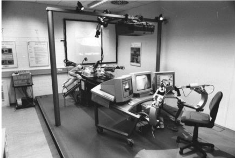
Slika 1. ARTEMIS – Advanced Robotic Telem manipulator for Minimally Invasive Surgery.

(preuzeto s https://allaboutroboticsurgery.com/surgical-robot-technology 27.7.2021)