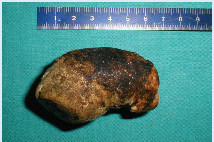
Slika 3. Prikaz žučnog kamenca ekstrahiranog iz pilorusa, dimenzija 7 x 3,5 x 2,5 cm.

U prikazanom slučaju pacijentice, akutni abdominalni bol te laboratorijski i slikovni nalazi ukazali su na bilijarnu etiologiju akutnog abdominalnog bola. Diferencijalno dijagnostički posumnjalo se na kolecistitis i patologiju vezanu uz prethodno dokazanu kolelitijazu. Tek je nakon dva dana, zbog pogoršanja kliničke slike, pacijentici na EGD-u dokazan etiološki uzrok akutnog abdominalnog bola. Naime, žučni kamenac pronađen u području pilorusa bio je toliko velik, da je uz opstrukciju pilorusa došlo i do pojave upalnog pro-