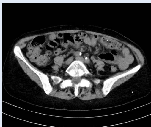
Slike 3. Nativni CT: glomazna kalcifikacija obje zajedničke ilijačne arterije, maksimalne debljine veće od 2 mm s konveksnim intraluminalnim rubovima, prema Davisovoj klasifikaciji M3.