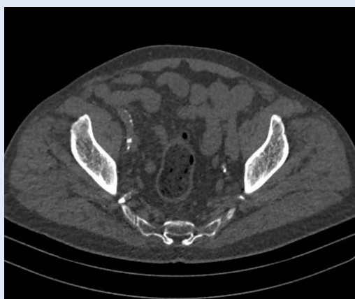
Slike 4. Nativni CT: kalcifikacije desne vanjske ilijačne arterije, duljina zahvaćenosti arterijskog segmenta je između 25 i 50 %, prema Davisovoj klasifikaciji L2.

u kojih smo u sklopu prijetransplantacijske obrade učinili CT (nativni ili s kontrastom) abdomena i zdjelice. Iz medicinske dokumentacije odredili smo osnovne demografske i kliničke podatke. Transplantacija je standardno učinjena u ilijačnu jamu. U pravilu smo lijevi bubreg stavljali u desno ilijačnu jamu i obrnuto, a sve s ciljem da pijelon transplantiranoga bubrega bude najpovršnija struktura. U pacijenata u kojih to nije bilo moguće (izrazite kalcifikacije ilijačnih krvnih žila, otprije prisutni transplantat) bubreg smo transplantirali na istu stranu (primjerice lijevi bubreg u lijevu ilijačnu jamu) tzv. „ upside-down “ tehnikom. Ovisno o kalcificiranosti krvnih žila ili položaju presatka renalnu arteriju smo anastomozirali na vanjsku