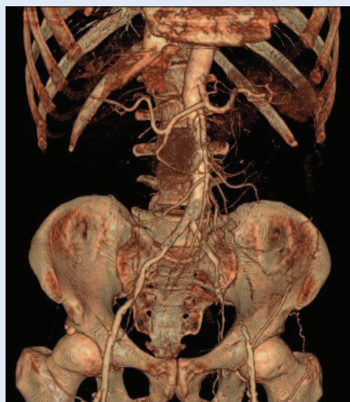
Slika 5. CT s kontrastom (uz rekonstrukciju krvnih žila): lijeva vanjska ilijačna arterija je potpuno kalcificirana te je kod pacijenata učinjena transplantacija u desnu ilijačnu jamu korištenjem desne vanjske ilijačne arterije.

Statističku obradu podataka učinili smo standardnim metodama uporabom kompjutorskog programa Statistica 13.5.0.17 (TIBCO Software, Palo