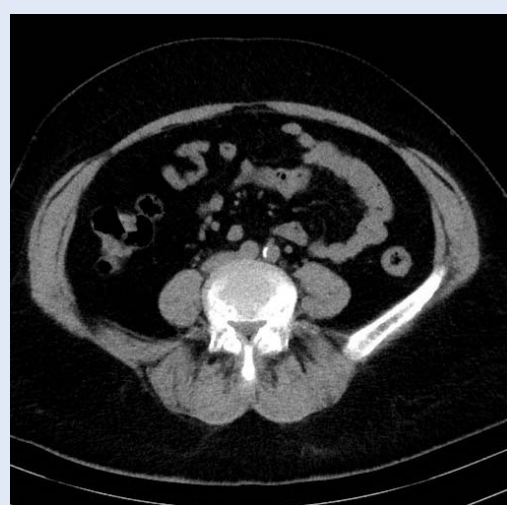
Slika 2. Nativni CT: deblja linearna kalcifikacija lijeve zajedničke ilijačne arterije, maksimalne debljine veće od 1 mm, prema Davisovoj klasifikaciji M2.