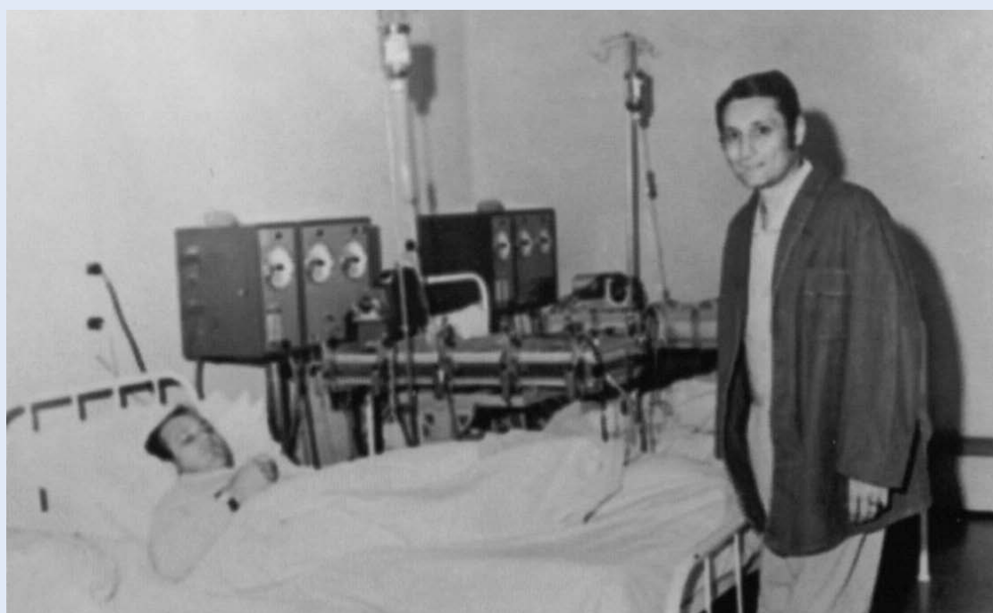
Slika 5. Prvi pacijent s transplantiranim bubregom u Rijeci posjećuje drugog pacijenta na hemodijalizi i ohrabruje ga da slijedi njegov primjer.