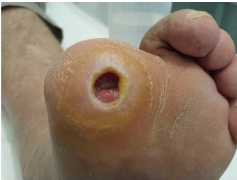
Slika 3. Ulkus dijabetičkog stopala (69)

dijabetičkom stopalu katastrofalnije nego drugdje uglavnom zbog određenih anatomskih osobitosti. Stopalo ima nekoliko odjeljaka koji međusobno komuniciraju i infekcija se može proširiti iz jednog u drugi, a nedostatak boli omogućuje pacijentu da nastavi s hodanjem dodatno olakšavajući širenje infekcije. Kombinacija neuropatije, ishemije i hiperglikemije pogoršava situaciju smanjujući obrambene mehanizme (69).