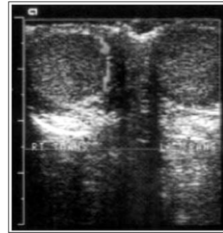
Slika 1. Ultrasonogram pokazuje torziju lijevog testisa kod četrnaestogodišnjeg dječaka koji je imao bol u lijevom testisu kroz 4 sata

Dijagnoza akutnog skrotuma se temelji na osnovi anamneze, kliničke slike, fizikalnog pregleda, laboratorijskih pretraga te radioloških metoda (9). Po-