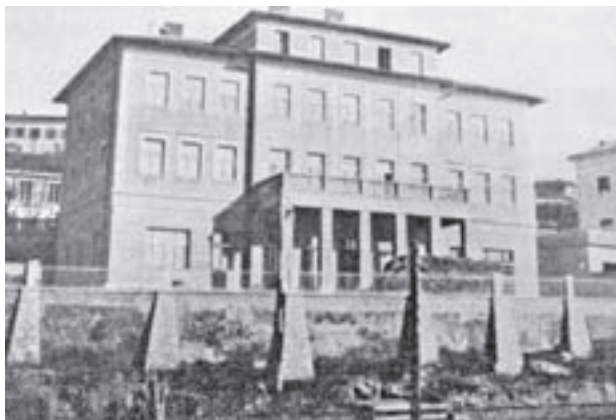
Slika 1. Dom narodnog zdravlja u Sušaku Figure 1. Building of the Health Centre in Sušak