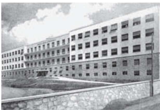
Slika 2. Zgrada Banovinske bolnice na Sušaku Figure 2. Building of the Banate Hospital in Sušak

skog primorja, Gorskog kotara te otoka Krka, Raba i Paga sa 143.086 stanovnika prema popisu 1931. godine,) radila 44 liječnika u Okružnom uredu za osiguranje radnika i u privatnoj praksi. Prema tome na ovom je području radilo tada ukupno 59 liječnika, pa je na jednog liječnika dolazilo 2425 stanovnika, što je za tadašnje doba bio iznimno dobar prosjek.