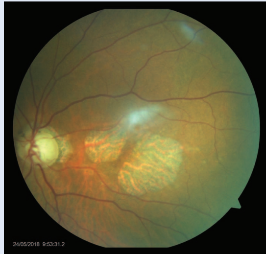
Slika 1. Atrofične promjene u makuli – fundus fotografija

Zbog biokemijskih promjena, prvenstveno slabe oksigenacije tkiva, stvaraju se signali za žilnicu koja počinje stvarati nove krvne žile, horoidalne neovaskularizacije (CNV, engl. choroidal neovascularization ) kojima se nastoji prokrviti dio oka s degenerativnim promjenama. Takve novonastale krvne žile prodiru u slojeve stanica putevima koji nisu prije postojali, čime se narušava arhitektura slojeva. Krhke i nedovoljno kvalitetne stjenke novotvorina razlog su da iz njih istječe tekućina, zbog čega dolazi do odizanja i razdvajanja pojedinih slojeva. Ovi procesi dovode do vlažnog oblika