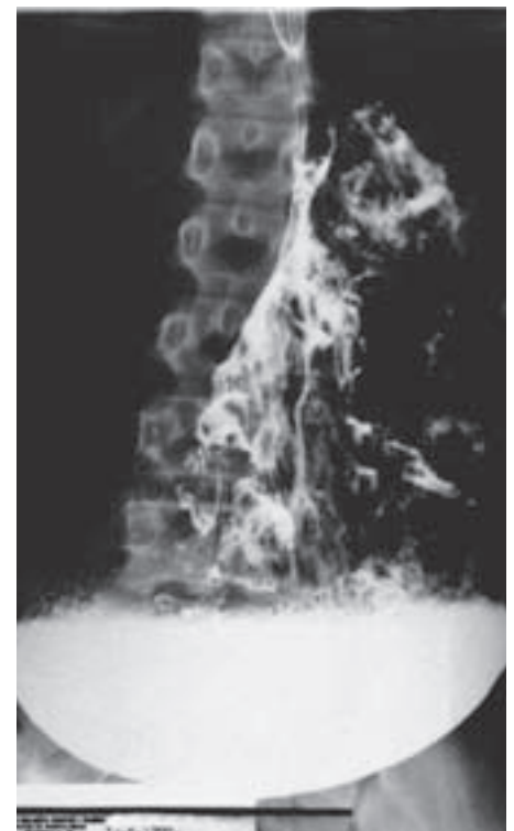
Slike 1, 2, 3 i 4. RTG snimka želuca 15, 30, 60 i 120 minuta nakon davanja obroka (motilitet želuca je minimalan – i nakon 120 minuta vidljiva je velika količina zaostalog kontrasta)

Figure 1, 2, 3 and 4. X-ray of stomach 15, 30, 60 i 120 minutes after the meal (minimal gastric motility – even 120 minutes after application a large amount of contrast is present)