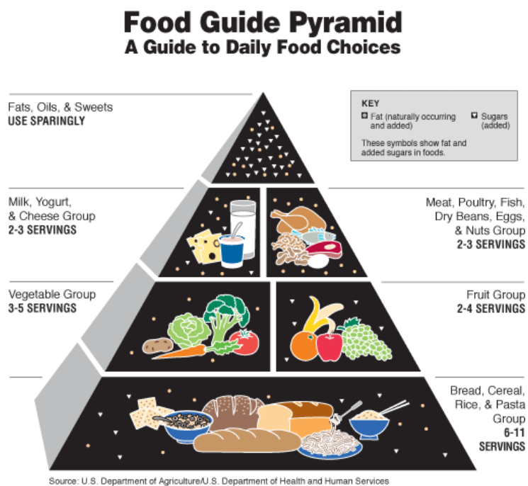
Slika 1. Prva piramida prehrane (9)

Povijest piramide pravilne prehrane zapravo potječe još iz 1894. godine, kada je američko Ministarstvo poljoprivrede prvi put izdalo vodič jednostavnih preporuka o pravilnoj prehrani. Nakon toga se neprestanim pokušajima istraživao najbolji model koji bi bio dovoljno zanimljiv da zaokupi pozornost šire populacije (8). Najprihvaćenije preporuke je objavio RDA (engl. Recommended Dietary Allowance ) 1989. godine u Sjedinjenim Američkim Državama, a dao je preporuke o dnevnim dozama hranjivih tvari (vitamina i mineralnih tvari), s obzirom na dob i spol te određena stanja kao što su trudnoća i dojenje. Konačno, prema tim preporukama američko Ministarstvo poljoprivrede 1992. godine je kreiralo prvu piramidu prehrane u cilju boljeg razumijevanja smjernica široj populaciji ili kao vodič pravilne prehrane (8).