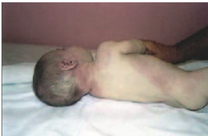
Slika 4. Vanjski pregled dojenčeta umrlog iznenadnom smrću na mjestu događaja (preuzeto na: Sudden infant death syndrome: a case report in Bosnia and Herzegovina, Dragan Ćajić, Husref Tahirović, Steven A. Koehler)

Vanjski pregled se sastoji od detaljne inspekcije svih vanjskih površina tijela. Nazočnost krvnih podljeva, kožnih vezikula ili pustula, petehije, uvučene fontanele, mrtvačke pjege na neuobičajenim mjestima na tijelu trebaju upućivati na dijagnozu s poznatim uzrokom smrti, a ne na SIDS. Moguća je vizualizacija retine direktnom ili indirektnom oftalmoskopijom kako bi se prikazala eventualna krvarenja. Prikupljaju se uzorci krvi, likvora i nazofaringealni bris za uvid u mogućnost postojanja infektivnog uzročnika. Nakon završenog vanjskog pregleda izvodi se radiološko snimanje skeleta tzv. babygram gdje su od važnosti kranioogram, radiogram grudnih organa, abdomena, zdjelice, ekstremiteta, s posebnim radiogramima za šake i stopala u lateralnoj i antero-posteriornoj projekciji.