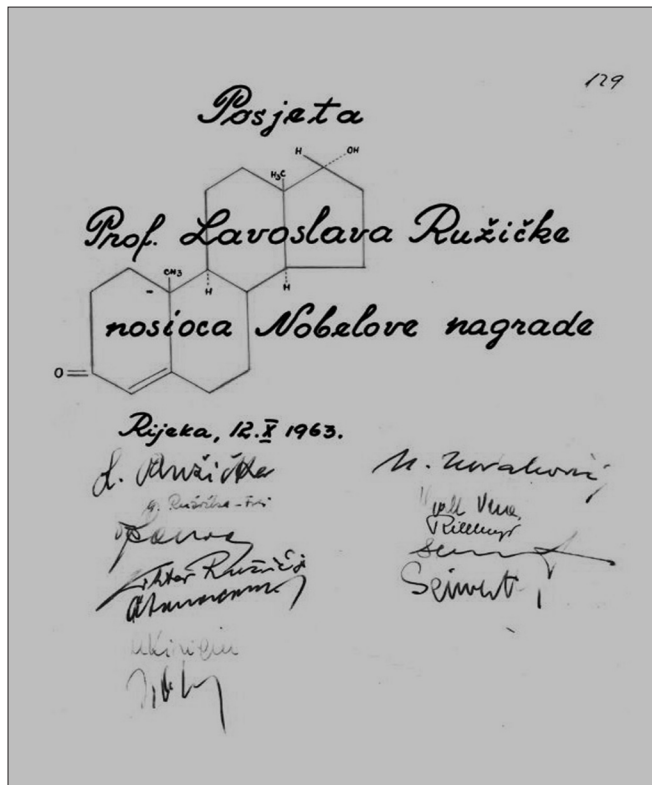
Slika 4 – Stranica iz spomen-knjige Društva: posjet nobelovca Lavoslava Ružičke održanog 12. rujna 1963.

Društvo surađuje s mnogim srodnim znanstvenim društvima, fakultetima i ustanovama u Hrvatskoj i inozemstvu. Nije ih lako sve nabrojiti: Farmaceutsko društvo, Društvo fizičara i matematičara, Prirodoslovno društvo, Prirodoslovno-matematički fakultet u Zagrebu, Farmaceutsko-biokemijski fakultet, Tehnološki fakultet, Kemijski fakultet, IMI,