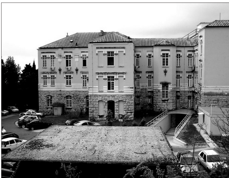
Slika 2 – Sjedište Društva na Medicinskom fakultetu Sveučilišta u Rijeci