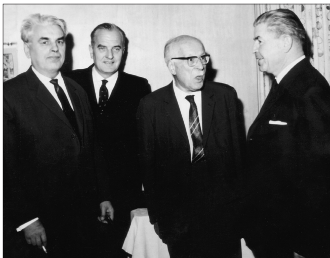
Slika 5 – Posjet i druženje s nobelovcem L. Ružičkom 12. rujna 1963. (s lijeva na desno) E. Cerkovnikov, N. Novaković, nobelovc L. Ružička, D. Jakac