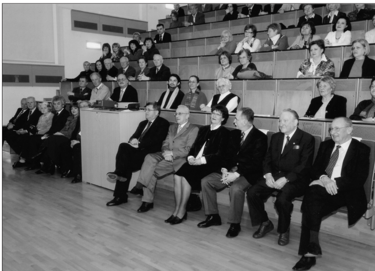
Slika 1 – Godišnja skupština održana 21. veljače 2008. povodom 50. obljetnice Društva

U Društvo su se s velikim entuzijazmom okupili kemičari grada i okolice. Poznato je da se članovi Hrvatskoga kemijskog društva okupljaju oko časopisa Croatica Chemica Acta ,