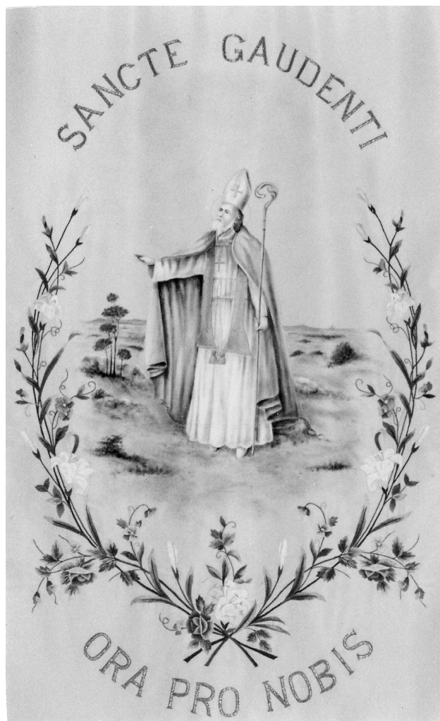
Slika 4. Sv. Gaudencije proklinje zmije koje nakon toga zauvijek napuštaju otok. Zastava katedrale u Osoru.

Od brojnih legendi koje će uz štovanje njegova kulta zaživjeti do današnjih dana, posebno je zanimljiva ona vezana za njegovo isposničko boravljenje u jednoj špilji na obližnjem brdu Osorčici. Kako je u to doba u okolini bilo dosta zmija otrovnica, koje su ga ne samo ometale u molitvama već su napadale i ostale ljude i životinje, budući ih je svetac prokleo i one su netragom nestale i nikada se više nisu pojavljivale. Kako ni dandanas na otocima Cresu i Lošinju nema otrovnica, pobožni puk pripisuje to svome svecu te ga dodatno štuje i kao zaštitnika od zmijskog i sličnih ujeda. Sačuvan je i jedinstven običaj otočana da, odlazeći s otoka, kao "škapular" uzimaju i sa sobom nose kamenčić iz Svečeve špilje (Slika 4).