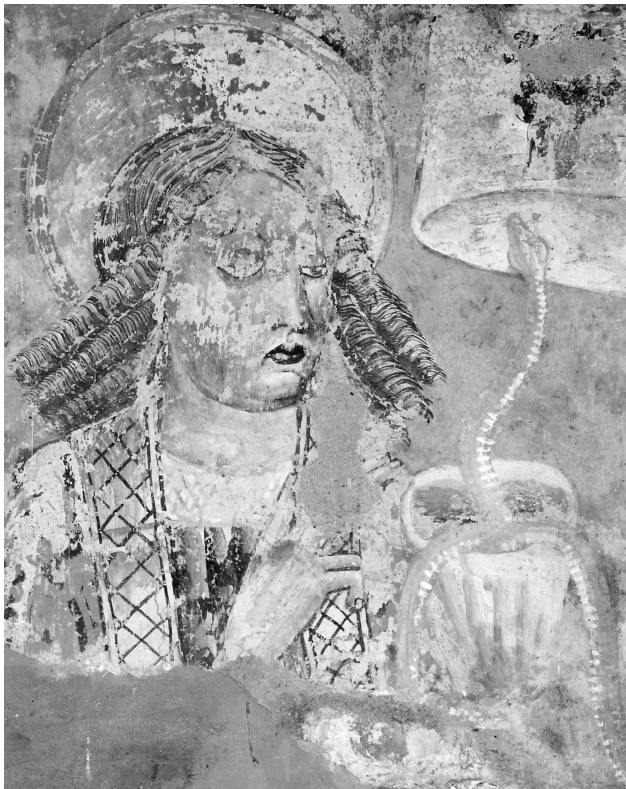
Slika 2. Vincent iz Kastva: Sv. Ivan Evadelist sa zmijom koja izlazi iz kaleža s otrovnim vinom. Freska iz 1474. u crkvi sv. Marije na Škrilinah u Bermu, Istra.

naškoditi. Ivan se nije dao zbuniti. Uvjeren u ispravnost onoga što je govorio, odlučno je prihvatio čašu. A zatim se dogodilo čudo – otrov uobličen u zmiju sâm je izašao iz kaleža te je Ivan bez posljedica ispio preostalo vino. Razumije se da je to bio dovoljno dojmljiv argument najprije u prilog ispravnosti njegovih propovijedi, da bi kasnije iz toga u pobožnom puku zaživjelo i vjerovanje u zaštitničke sposobnosti tog sveca vezano za ugrize otrovnih zmija (Slika 2).