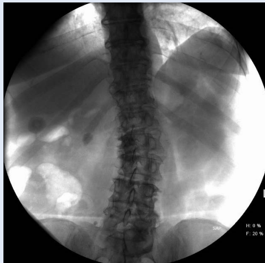
Slika 2. Kamenac u pijelonu desnog bubrega

Od 1. kolovoza 2015. godine do 31. prosinca 2016. godine u našem centru šest pacijenata operirano je metodom miniPCNL-a. Među njima su bile tri žene, a prosječna dob bila je 50,5 godina (raspon 28 – 76 godina). Indeks tjelesne težine bio je od 24,2 – 30,5. U svih pacijenata kamenac je bio u desnom bubregu, od čega u 5 njih u pijelonu, a kod jednog pacijenta u donjoj skupini čašica. Veličina konkrementa kretala se od 13 × 8 mm do 24 × 20 mm (slika 2). U jednog pacijenta kamenac je bio u transplantiranom bubregu. Laserska litotripsija uspješno je učinjena u svih pacijenata te na kontrolnoj RTG snimci mjesec dana nakon operacije nije bilo ostatnih fragmenata. Sama operacija trajala je između 120 i 210 minuta s time da je prva operacije trajala najdulje, a kasnije se duljina operacije smanjivala. U troje pacijenata kamenac je