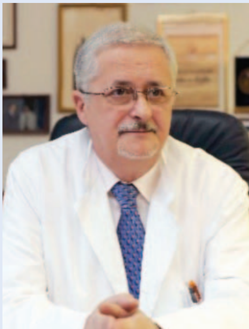
Slika 7. Prof. dr. Željko Fučkar

Usprkos ratnim zbivanjima i političkim promjenama u Republici Hrvatskoj transplantacije bubrega