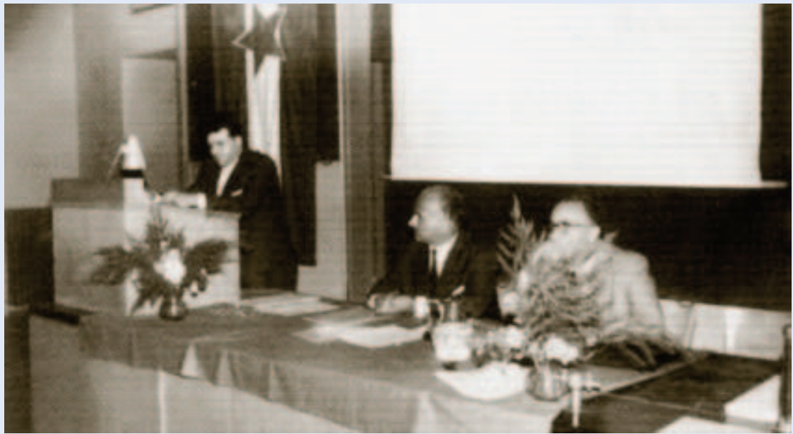
Slika 3. Osnivački sastanak urologa Hrvatske 1959. godine u Rijeci

Odjel odnosno Klinika za urologiju uvijek se vezuju uz moderna dostignuća urološke struke. Najzapaženiji rezultati ostvareni su u sklopu transplantacijskog programa (2006. postaje Referalni centar za transplantaciju bubrega u Hrvatskoj), rekonstrukcijske urologije, endourologije i uroonkologije. Nezaobilazno je spomenuti da su tijekom cijelog Domovinskoga rata urolozi neumorno i aktivno sudjelovali u obrani svoje domovine.