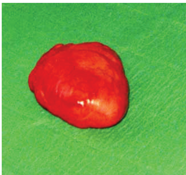
Slika 2. Kirurški odstranjen intratorakalni lipom

Figure 1 Intrathoracic lipoma shown by the computerised tomography (CT) of the thorax