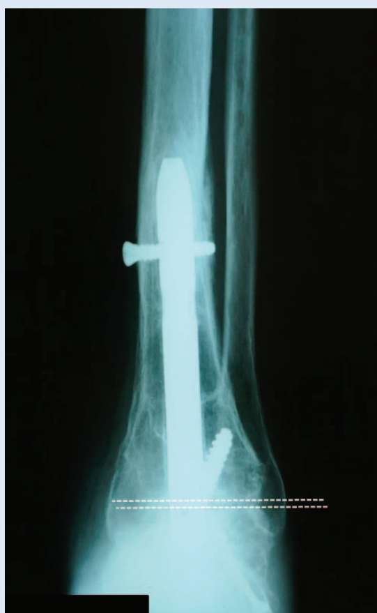
Slika 3a. Poslijeoperacijska AP projekcija pokazuje područje zglobne pukotine koja je okomito u odnosu na anatomsku osovina tibije, što označava fiziološki položaj stopala.

Nakon standardnog postupka pripreme pacijenta i pokrivanja operacijskog polja, učinjen je lučni rez u području anterolateralnog dijela gležnja. Prikazan je tibiotalarni zglob s potpuno luksiranim talusom, te talonavikularni i kalkaneokuboidni zglob, uklonjene su hrskavice, te dio talusa. Postavljeni su vijci i učinjena artrodeza talonavikularnog i kalkalneokuboidnog zgloba. Stopalo je postavljeno u plantigradni položaj te pod kontrolom rendgena, retrogradno kroz petnu kost uveden je TTK kompresivni čavao. Kroz čavao su, također pod kontrolom rendgena, postavljeni kompresivni vijci.