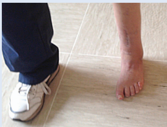
Slika 4a,b. Hod i položaj stopala 5 mjeseci nakon operacije

Na poslijeoperacijskim RTG snimkama utvrđeno je da su u cijelosti korigirani kutovi. Na AP snimci područje zglobne pukotine postavljeno je okomito na anatomsku osovinu tibije, a lateralni tibiokalkanealni kut iznosio je 70°, što je značilo da je stopalo postavljeno u fiziološki-plantigradni položaj (slike 3a,b).