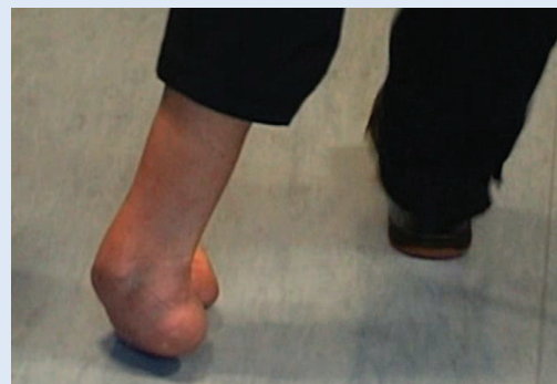
Slika 1a,b. Položaj stopala pri hodu prije operacijskog liječenja