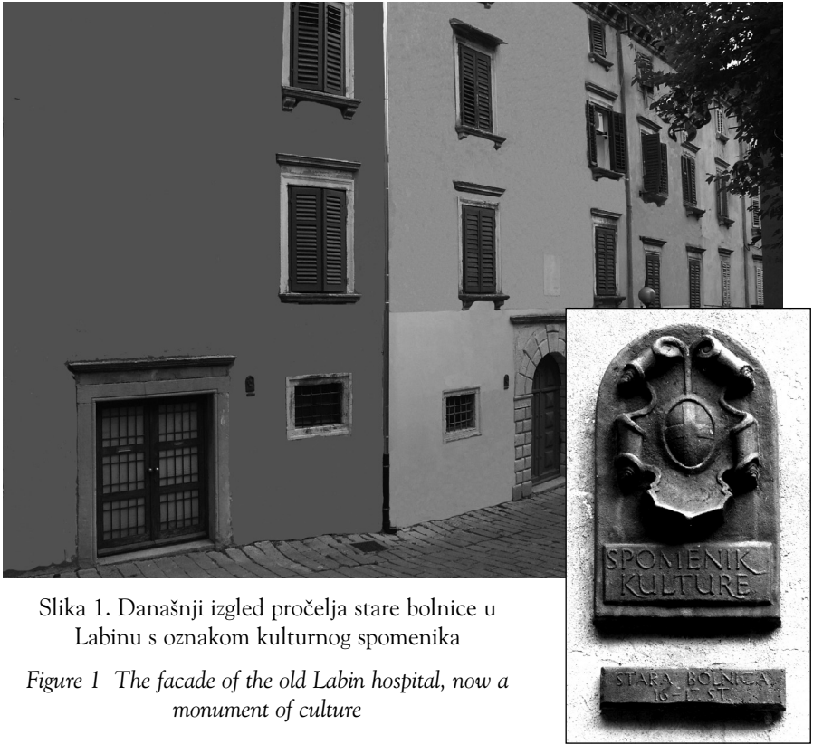
Slika 1. Današnji izgled pročelja stare bolnice u Labinu s oznakom kulturnog spomenika