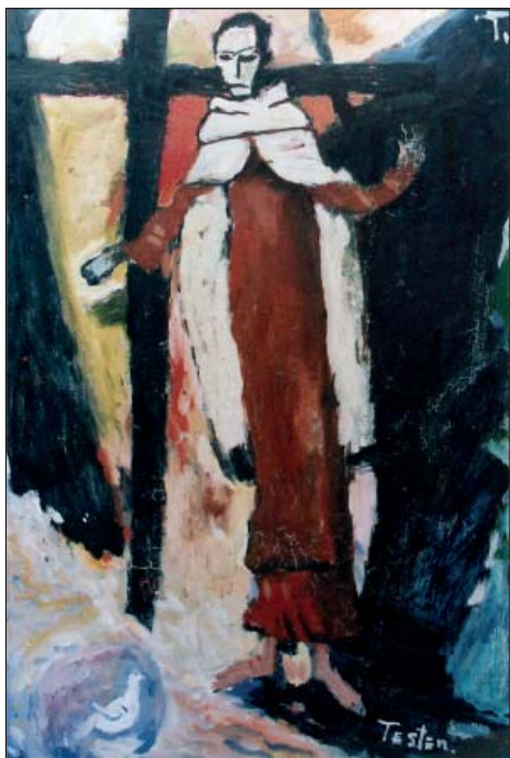
Ambroz Testen: Sv. Ivan od Križa, ulje na lesonitu, franjevački samostan sv. Eufemije, Kampor, Rab

Ambroz Testen: St. John of the Cross. Oil on hardboard. Franciscan monastery of St. Euphemia, Kampor, Rab (Croatia).