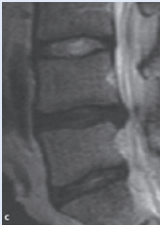
Slika 1. MRI lumbalne kralježnice Figure 1 MRI of lumbal spine