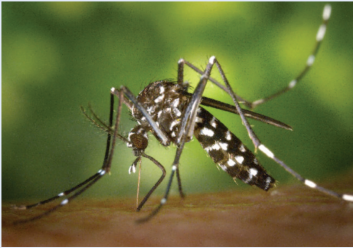
Slika 1. Azijski tigrasti komarac ( Aedes albopictus ) Figure 1 Asian tiger mosquito ( Aedes albopictus )