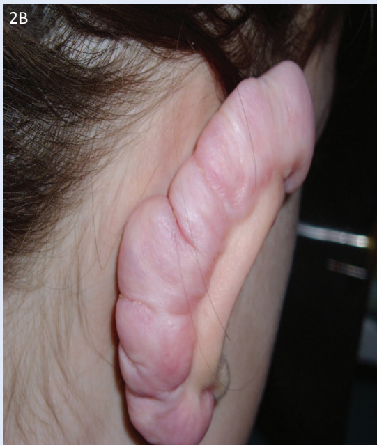
Slika 2. Keloid na ušci: A) lijeva uška; B) desna uška Figure 2. An auricle keloid A) Left auricle B) Right auricle