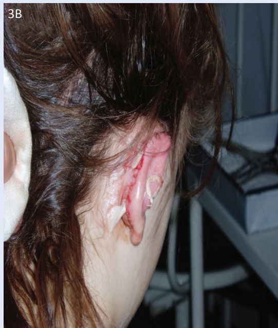
Slika 3. Bolesnica 10 dana poslije ekscizije keloida: A) s lijeve strane; B) s desne strane Figure 3. The patient seen 10 days after keloid excision A) View from the left B) View from the right

Na desnoj ušci veličina keloida bila je oko 4x3 cm, dok je na lijevoj ušci keloid bio veličine oko 4x1,5 cm (slika 2A, 2B). Tada smo u općoj anesteziji učinili kiruršku eksciziju keloida na obje uške. Zahvat je uključivao odstranjenje keloida kirurškim nožem br. 15 do hrskavice. Ranu smo primarno sašili, pri čemu smo veliku pozornost posvetili postizanju minimalne tenzije, kako bismo spriječili ponovnu pojavu keloida (slika 3A, 3B). Poslijeo-