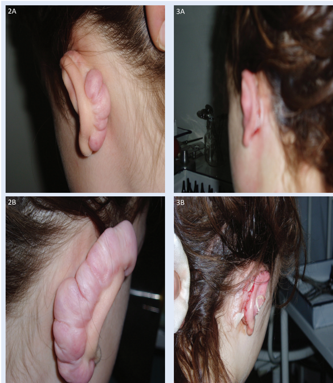
Slika 2. Keloid na ušci: A) lijeva uška; B) desna uška Figure 2. An auricle keloid A) Left auricle B) Right auricle