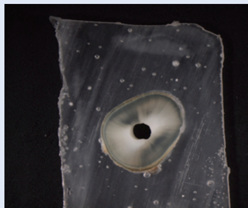
Slika 4. Presjek središnje trećine korijenskog kanala nakon 5-minutnog djelovanja EDTA-e Figure 4. Cross section of middle third of root canal after five minute irrigation with EDTA

Dobiveni rezultati ovog istraživanja stoga su u skladu s brojnim ispitivanjima drugih autora, te je potvrđena učinkovitost uklanjanja zaostatnog sloja uporabom 17 %-tne otopine EDTA-e tijekom određenog vremenskog perioda. Najbolji učinak glede uklanjanja zaostatnog sloja postignut je u cervikalnoj i središnjoj trećini korijenskog kanala, dok je u apikalnoj trećini, kao posljedica otežanog prodora irigansa, prisutno najviše zaostatnog sloja.