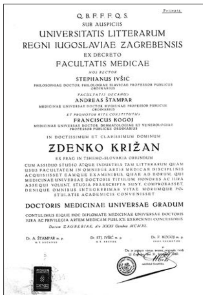
Slika 4. Prijepis diplome o stečenoj tituli doktor medicine.