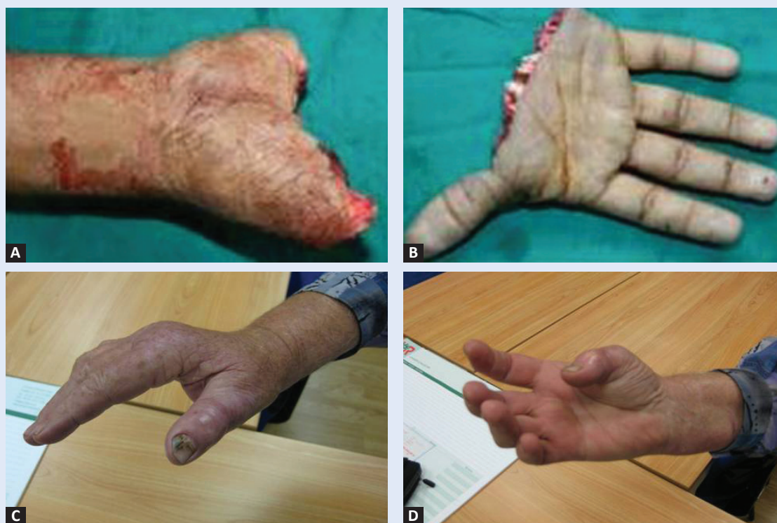
Slika 1. A i B) Traumatska metakarpalna amputacija; C) Funkcijski rezultat nakon replantacije – pronacija; D) Funkcijski rezultat nakon replantacije – supinacija.

Većina "velikih" amputacija također se javlja na radnom mjestu. Veliki industrijski strojevi, indu-